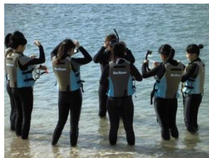
シュノーケリング