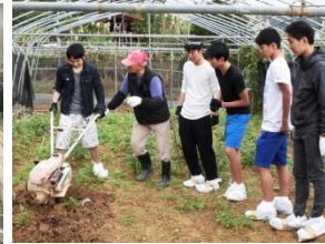
耕運機で耕しました