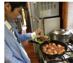
サーターアンダギー 揚げました