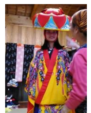
琉球衣装 着せてもらいました