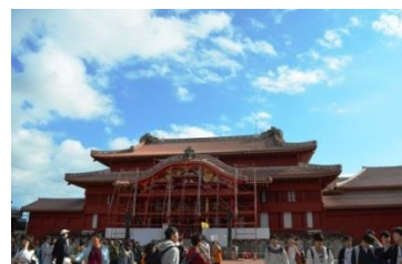
首里城の外壁は改修工事をしていました