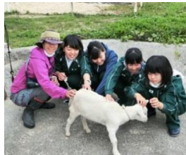
ヤギとのふれあい